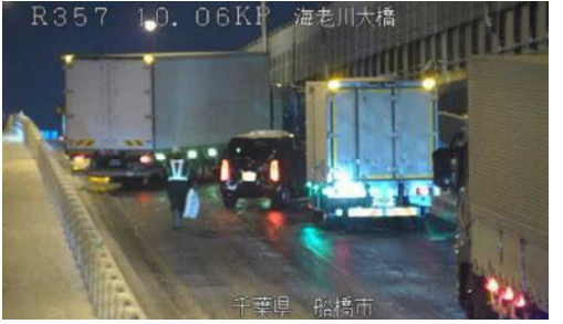
国道357号 路面凍結によるスリップ事故 <令和4年1月7日>