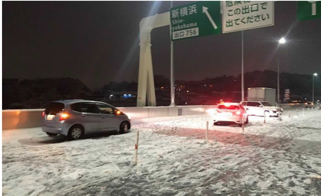
冬タイヤやチェーン未装着車両による立ち往生 ＜首都高速道路 横浜北線＞