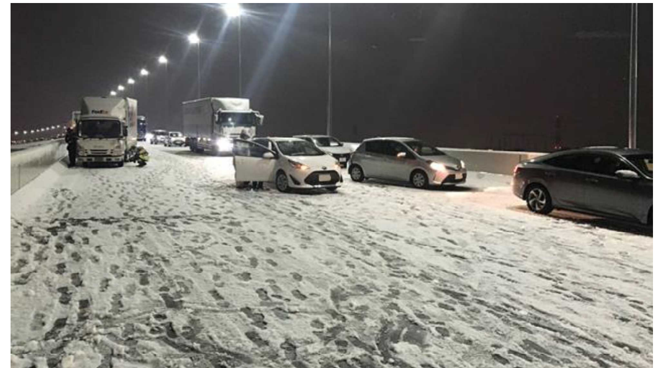
車両の滞留 ＜首都高速道路 中央環状線＞