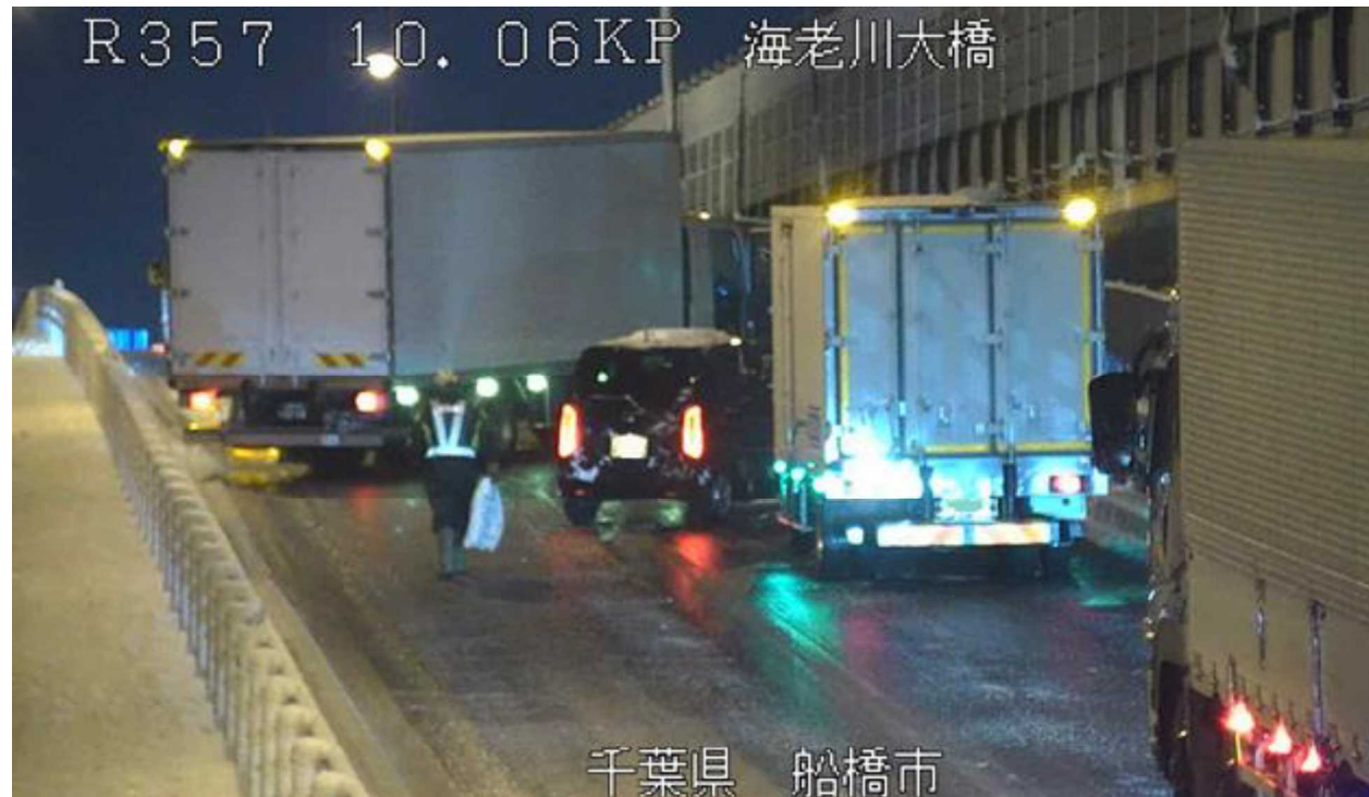
冬タイヤやチェーン未装着車両によるスリップ事故 ＜国道357号＞