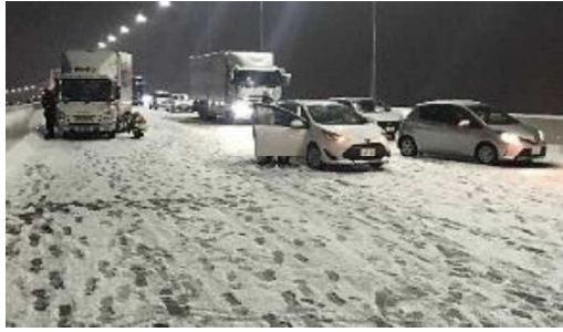
首都高速中央環状線の立ち往生発生状況 <令和4年1月6日>

○このほか、主要な国道においても冬タイヤやチェーン未装着車によるスリップ事故が多発しました。